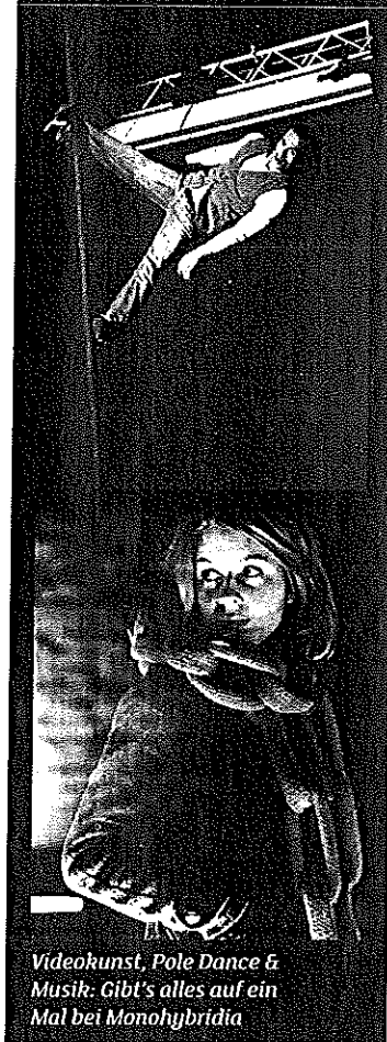
Videokunst, Pole Dance & Musik. Gibt's alles auf ein Mal bei Monohybridia

Monohybridia: 11.6. ab 20 Uhr, Alte Lagerhalle, Friedensallee 126 a (Bahrenfeld); www.monohybridia.org