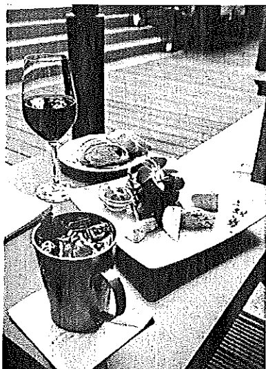
Feines Stilleben: Moscow Mule & Käseplatte

Schischiboat: 29.6., ab 19 Uhr, an der Landungsbrücke 10; www.literaturveranstaltungen.com